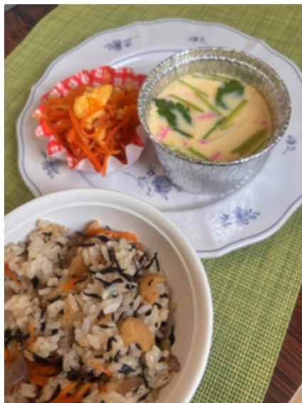
・ジューシー（沖縄の炊き込みご飯） ・人参しりしり

修学旅行に向かう二年生には気を付けての気持ちを含めて、寮に残る生徒たちにも沖縄を感じられるメニューを提供しました。 修学旅行でタコライスを食べたよ！また、食堂でも出してほしい！と土産話に花が咲き、生徒からのリクエストにより、今では定番メニューになりました。