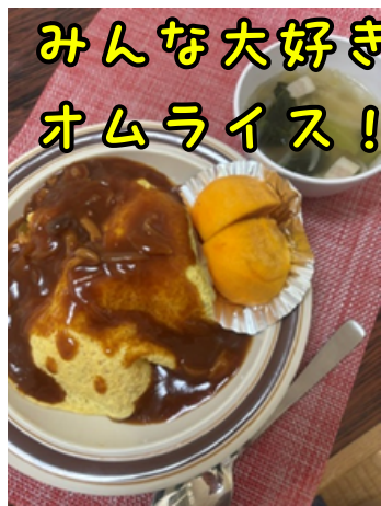
みんな大好き オムライス!