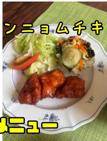
ヤンニョムチキン