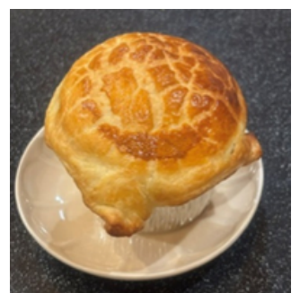
あったかポットパイ