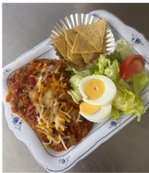
・タコライス ・サーターアンダギー