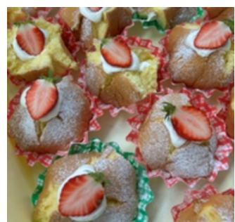
手作り いちごケーキ

生徒アンケートより ・3年間の中で一番美味しいクリスマス会でした。 ・クリスマス会をこんなに楽しく過ごせたのは間違いない ・食事のおかげだと思えます! 素敵なプレートとデザートを提供していただき本当に嬉しかったです。 ・寮であのような素晴らしいメニューが食べれるとは思っていませんでしたので感動しました。 ・量が多かったけど、味は全部めちゃくちゃ美味しかったです。豪華なご飯をありがとう。