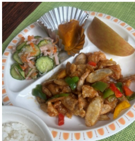
隠れ人気メニュー 山口県の学校給食でも人気 『チキンチキンごぼう』

意外に知られていない… 但馬 日本海の味 一夜干しカレイ 初めて食べた!との声にビックリ