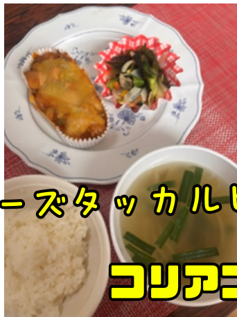
チーズタッカルビ