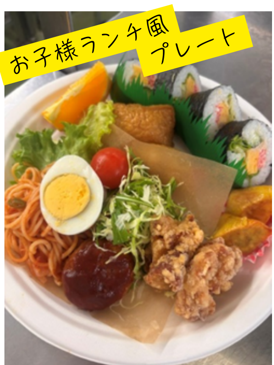
クリスマス風 プレート お子様ランチ風